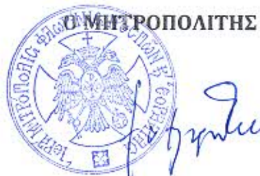
†Ο ΦΛΩΡΙΝΗΣ ΠΡΕΣΠΩΝ & ΕΟΡΔΑΙΑΣ ΘΕΟΚΛΗΤΟΣ