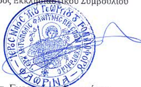
Αιδεσ. Γκερτσάκη Αναστάσιο